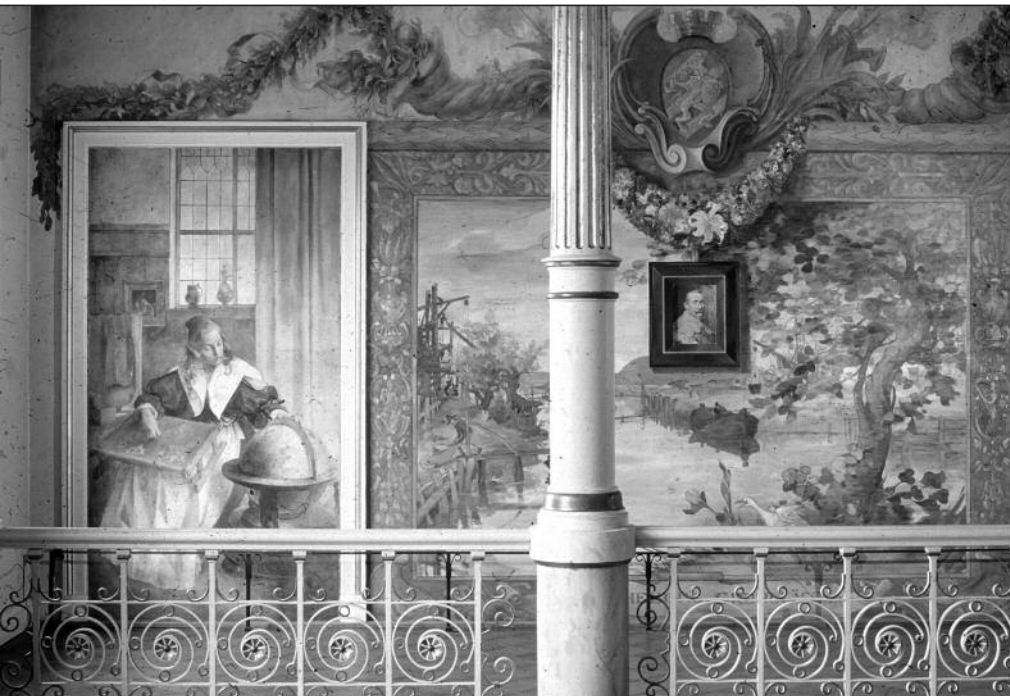
1600-talsdelen av Carl Larssons utsmyckning Svenska kvinnan genom seklen i Nya Elementarläroverket för flickor i Göteborg (nuvarande Engelbrektskolan).

antal porträtt av berömda historiska män med anknytning till Göteborg. Just porträtt och porträttserier kom att spela en viktig roll i de svenska skolutsmyckningarna. Det viktigaste skälet till porträttens popularitet i utsmyckningarna var nog föreställningen att en avbildning av en framstående och förebildlig person hade ett gott inflytande på betraktaren. Carl Larssons flickskoleutsmyckning skildrade den svenska kvinnans historia från stenåldern till samtiden. Också här fanns ett antal porträtt av historiska personer.