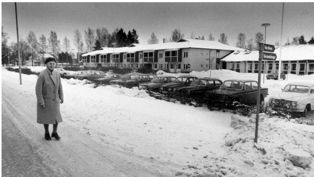
En bild av miljön kring ett vårdhem.

Litteratur: SPRF – Krönika 1937-2006: Inför SPRF:s 70 Årsjubileum 2007.