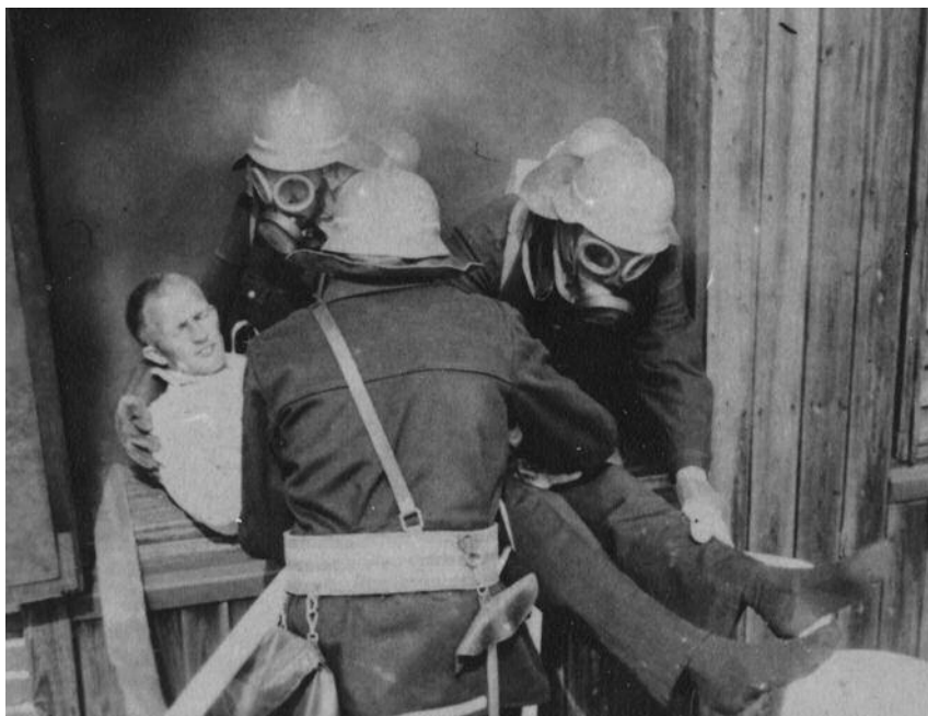
En man räddas ur ett rökfyllt rum. Händelseförloppet vid bränder kan vara mycket dramatiskt.

De övriga sektionerna i boken: "Om brandbefälets roll", "Över gränserna", "Innanför uniformen" och "Framtiden" är klart läsvärda även för en bredare allmänhet. De är ofta journalistiskt skrivna och