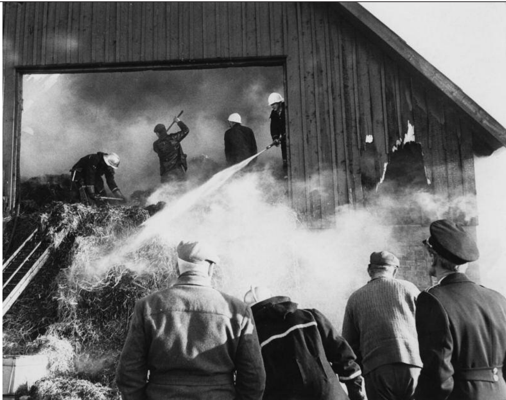
Brandkåren i arbete: släckningsarbete vid en lada.

I avsnittet "Över gränserna" förmedlas inblickar i brandbefälens internationella arbete. År 1988 åkte svensk räddningstjänst till det jordbävningdrabbade Armenien. Det blev en dramatisk upplevelse. Sorg. Rader av kistor. Människor som skriker när de finner döda anhöriga. Brandmännen konfronteras med en helt annan verklighet än i det lugna,