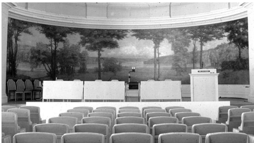
Prins Eugens landskapsmålning Sommar på fondväggen i Norra Latins aula i Stockholm.

Men landskapsbilderna i skolorna kan samtidigt sägas vara bärare av en rad idéer som kring sekelskiftet 1900 förknippades med den svenska naturen. Naturen som estetisk och ekonomisk resurs blev nu kärnan i den svenska nationalismen. Tidigare under 1800-talet hade