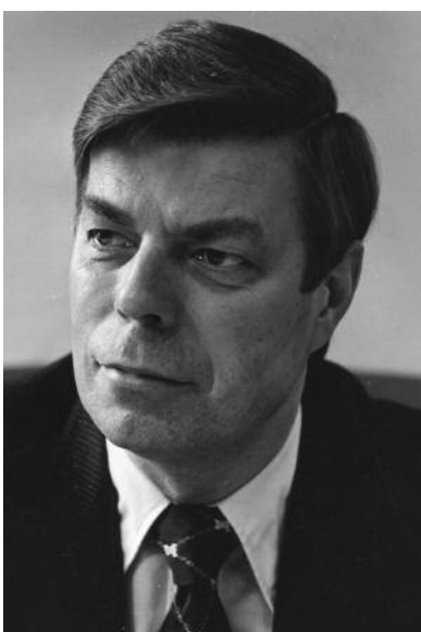
Lennart Bodström var TCO:s ordförande mellan 1970-1982.

En framgångsrik fackföreningsledare – liksom en politiker eller försäljare – måste ha en (medfödd eller förvärvad) vinnande personlighet; han eller hon måste kunna just vinna människors (om än inte riktigt alla människors) sympati och förtroende, ty annars är han eller hon dömd att bli en förlorare. Inom fackföreningsrörelsen – liksom i politiken eller i affärer