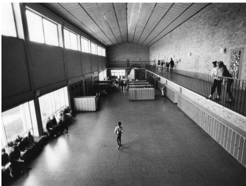
Efter andra världskriget sjönk intresset för idealiserad konst och förebildliga gestalter. Här en skolmiljö från 1980-talet.