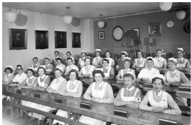
De nyblivna barnmorskorna på examensdagen, torsdagen den 30 juni 1960.