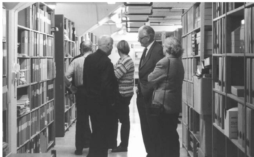
TAM-Arkivs nuvarande lokaler på Västmannagatan i Stockholm. Öppet Hus under Arkivens Dag 1998.

De flesta arkiv önskar – förutom att ge service åt sina arkivbildare – att deras material i största möjliga utsträckning ska komma till användning i olika former av kunskapsutveckling. I själva verket är också en stor del av grovjobbet i arkiven inriktat på att göra materialet