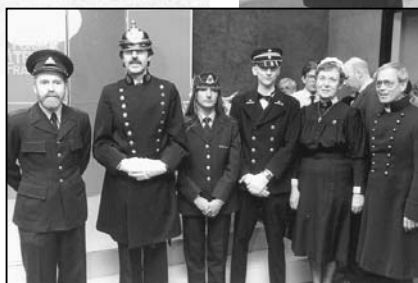
Invigningen av TAM-Arkiv i lokalerna på Cardellgatan den 26 april 1985.

de han klart att "betalningsviljan" från statens sida var länkad till organisationsförhållandena på ett helt annat sätt. I klartext: Han ville se en bredare medlemsbas för den nya föreningen/institutionen som inkluderade även SACO-familjen.